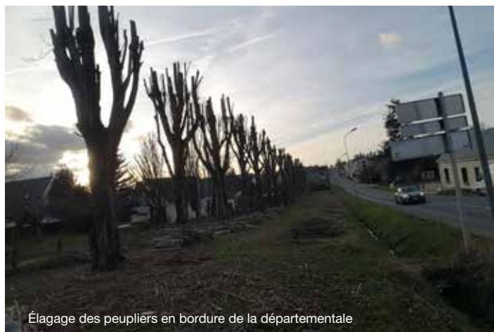
Élagage des peupliers en bordure de la départementale