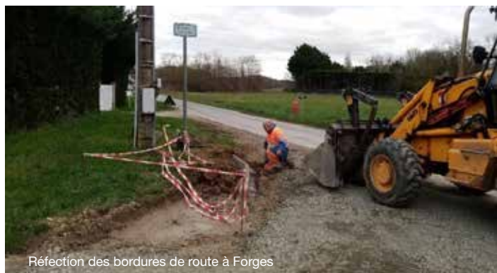
Réfection des bordures de route à Forges