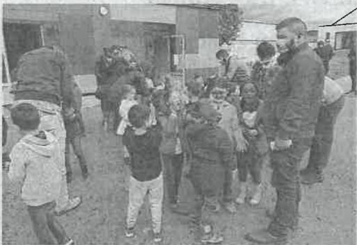
La bonne volonté et l'enthousiasme ont été douchés par la pluie.

Il y avait beaucoup de bonnes volontés vendredi 25 septembre après-midi à l'école Robert-Doisneau de Véretz. Enfants, enseignants et parents s'étaient retrouvés pour l'opération « Nettoyons la nature », qui consiste à net-