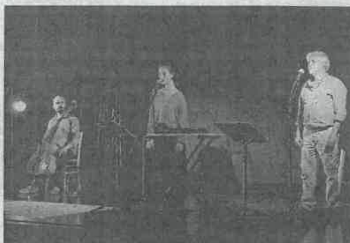
Le magnifique spectacle du trio Hellébore a mis à l'honneur le patrimoine de Véretz.