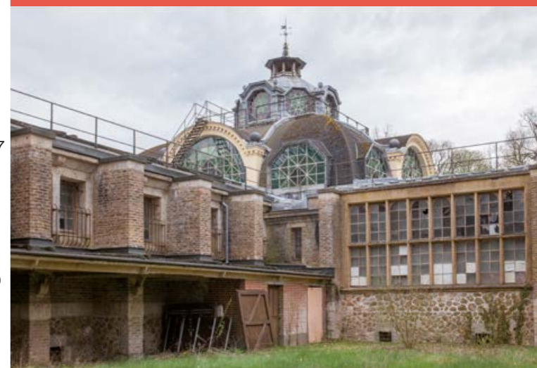
ARN - Nouzilly

→ CCC OD Jardin François 1 er - 37000 Tours plus d'infos : www.cccod.fr