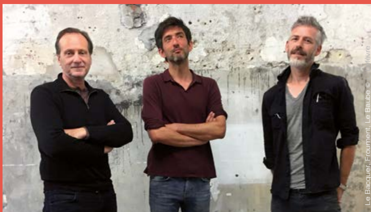
Le Bacquer, Froument, Le Baube

→ Rue de la République - Rue Carnot - Route de Parçay - Chapelle de l'Hôpital 37220 L'Île-Bouchard