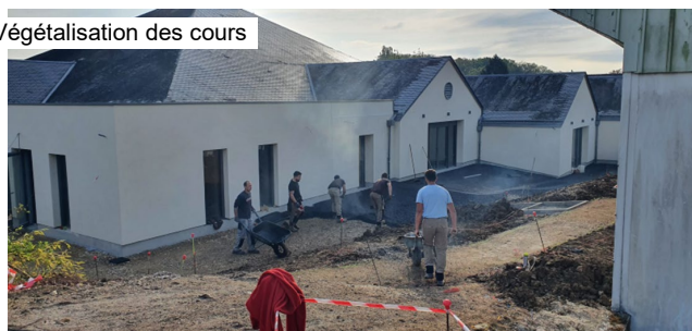
Végétalisation des cours