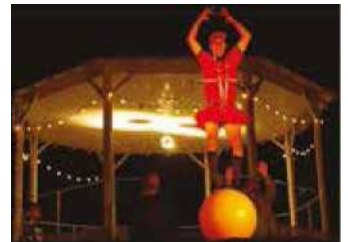
Week-end de bonne humeur assuré !

Profitez de ces temps festifs et conviviaux qui vous sont offerts.